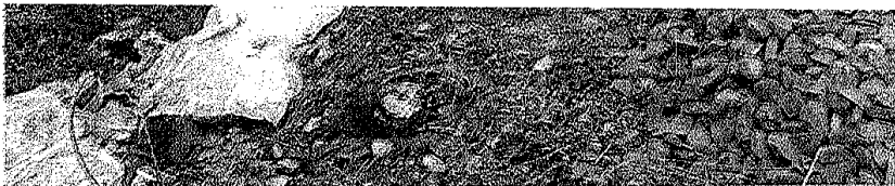
Alcune immagini dei rifiuti abbandonati lungo la linea ferroviaria Avezzano-Roccasecca

anni, che sulla sua paginella ha pubblicato foto dei ritrovamenti fatti dai agenti. Così, se da un'attività continua la lotta di comitati che richiedono l'edificata riapertura della linea la cui chiusura andrebbe azzere l'intera Valle Rovell'altra gli incivili che gettonomia in ogni dove, ne curano affatto. Il nambiente, composto da De Michelis, Marco Fratlio Ruscitti e Davide Colal comando del capitano ni, continua la caccia alscariche abusive. Solo he settimana fa gli agenti no segnalato la presenza ti in Peschio Vitale, non o dai binari della ferroavevano richiesto l'interdella Tekneko e degli i del Comune. (m.t.)